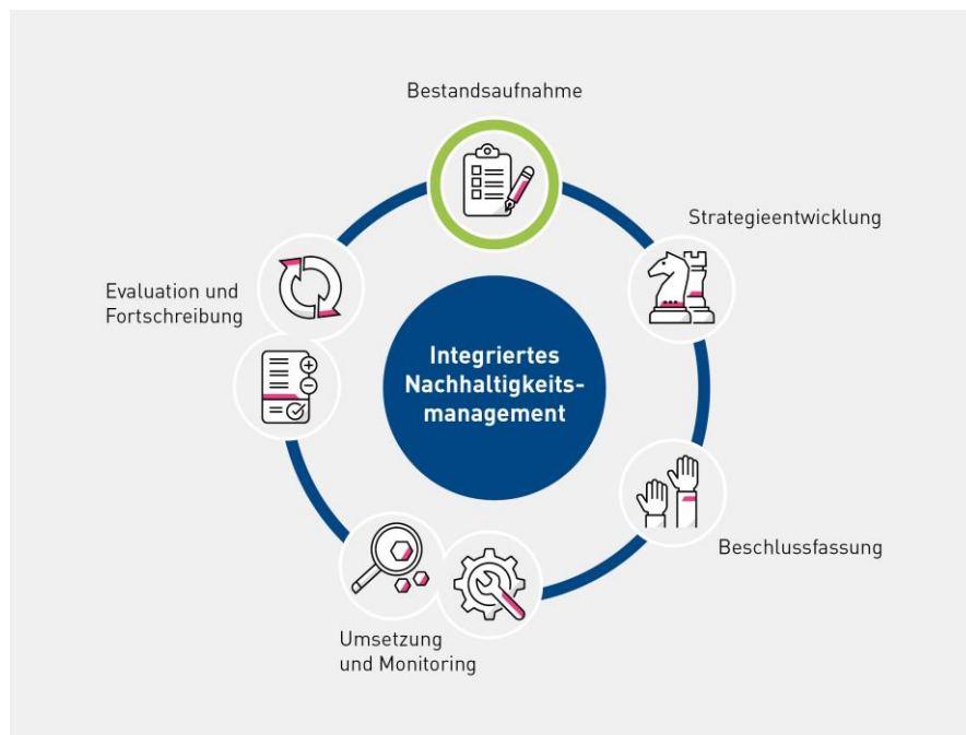
Abbildung 1: Integriertes Nachhaltigkeitsmanagement in Kommunen

Final wird festgestellt, dass das Konzept des Gemeinwohls als inhaltliche Ergänzung und Weiterentwicklung des Nachhaltigkeitskonzepts verstanden werden kann. So empfehlen die Autor:innen der Studie die Integration der Gemeinwohlorientierung in das kommunale Nachhaltigkeitsmanagement, da erst gemeinsam geteilte Wertvorstellungen die Verfolgung von Public Value, Common Good oder Gemeinwohl in der Kommune ermöglichen. Somit steht am Anfang des Prozesses die Betrachtung des Gemeinwohls, verstanden als Grundlage einer wertorientierten nachhaltigen Entwicklung der Kommune.