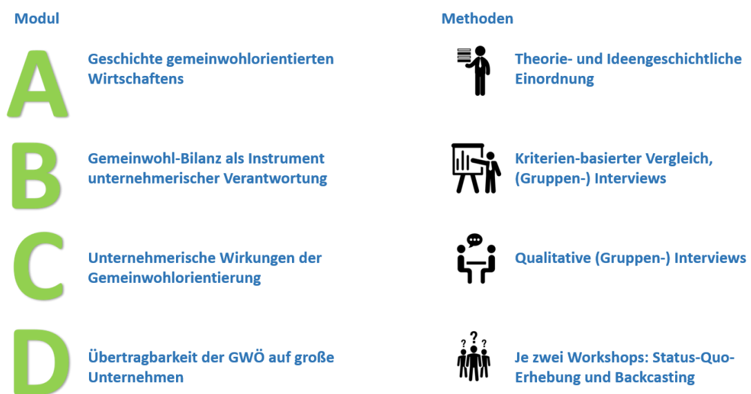
Abbildung 1: Module im Projekt GIVUN

Abbildung 1 stellt die Arbeit in den Modulen schematisch dar.