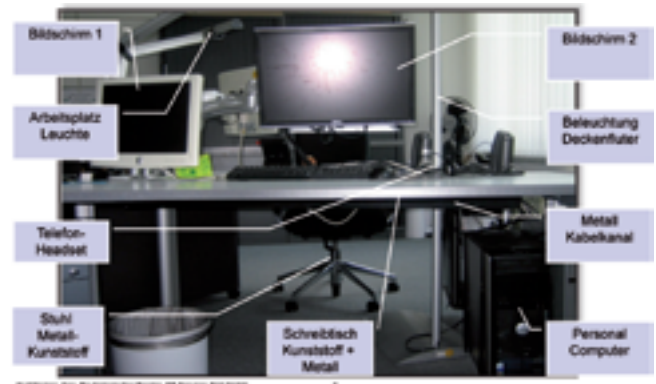
Ein Beispiel aus heutigen Tagen 5 elektrische Geräte + Headset, keine mechanischen Geräte

die Maßnahmen richtig gut und das Beste daran war für sie und die Arbeitnehmervertretung, dass die Geschäftsleitung das von sich aus durchgeführt hat, ohne dass sie sich das erkämpfen mussten.