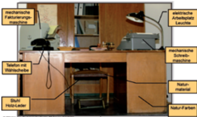
So sah der Schreibtisch noch vor 40 Jahren aus 1 elektrisches Gerät + Telefon + 2 mechanische Geräte